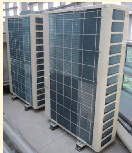
JL 搭配室外機按裝示意圖